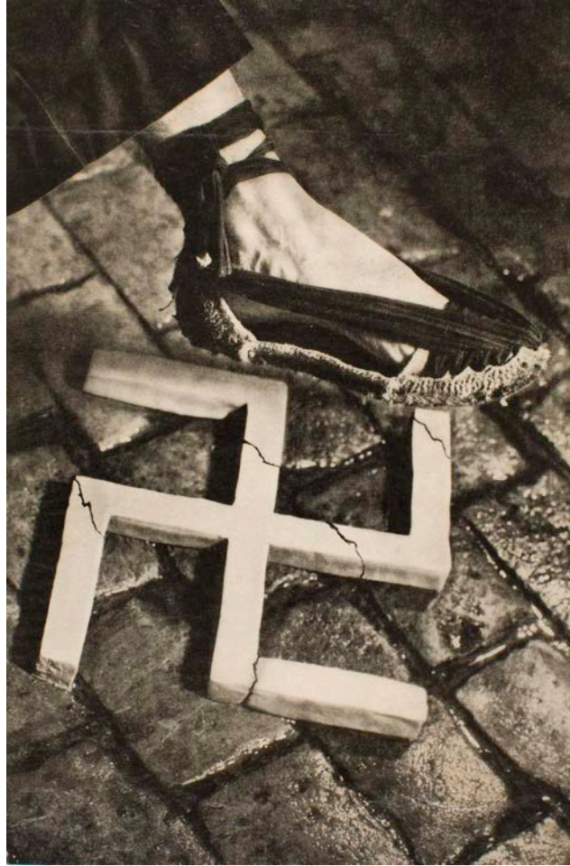
FONT: Pere Català Pic, «Aixafem el feixisme», 1937.