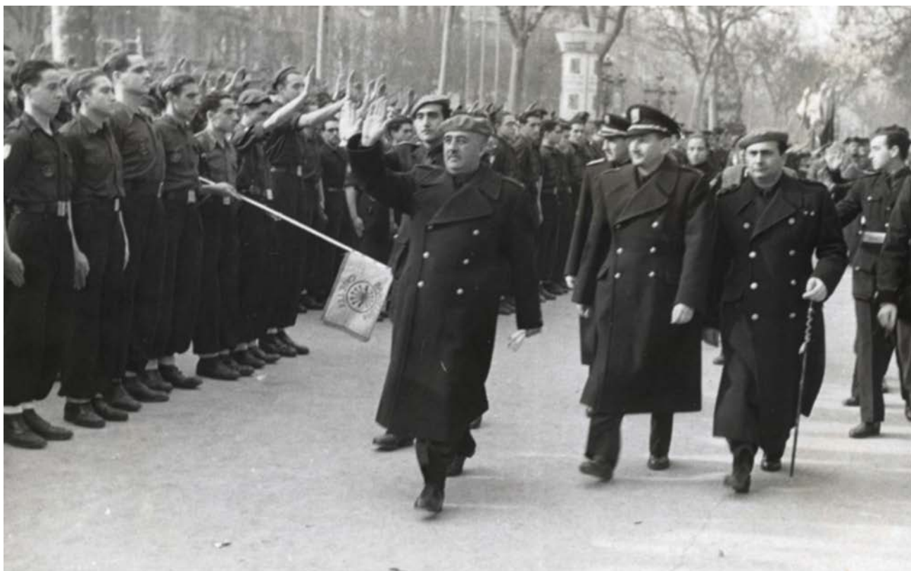
Visita de Franco a Barcelona, 30 de gener de 1942.